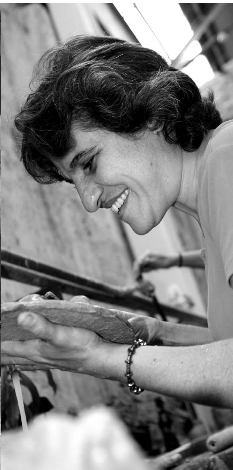
Galería de Papel. Taller Contacto. 2009.