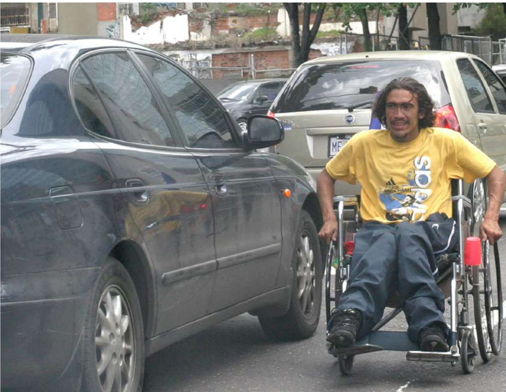
Galería de papel. William Dumont (2017)