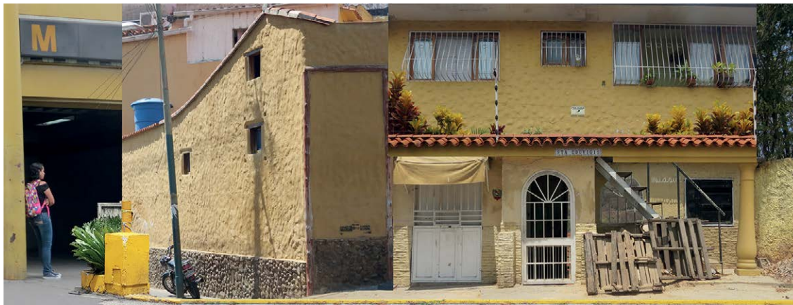
Galería de papel. Constantes urbanas . Raquel Soffer (2018)

forma con el testimonio: ella indaga e interviene. Al hacerlo, extiende el imaginario y lo hace más complejo. Por lo tanto, la idea de contaminación es necesario vincularla con pensar, investigar, relacionar e imaginar. Con darle densidad al espacio en cada nueva intervención. Es el sentido que el poeta francés Antonin Artaud le dio: “comprender es contaminar el infinito”.