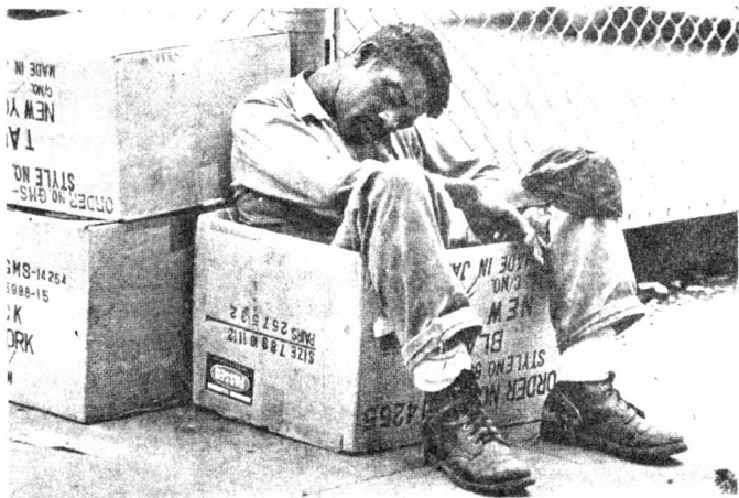
Solidaridad con los sin voz y los sin poder.

43. Las comunidades jesuitas tienen que ayudar a cada uno de sus miembros a vencer las resistencias, temores y apatías que impiden comprender verdaderamente los problemas socia-