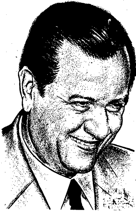
Elegido por aclamación

Uruguay, Bahrain (Golfo Pérsico) e Indonesia por hacer desaparecer o asesinar a parlamentarios democráticos.