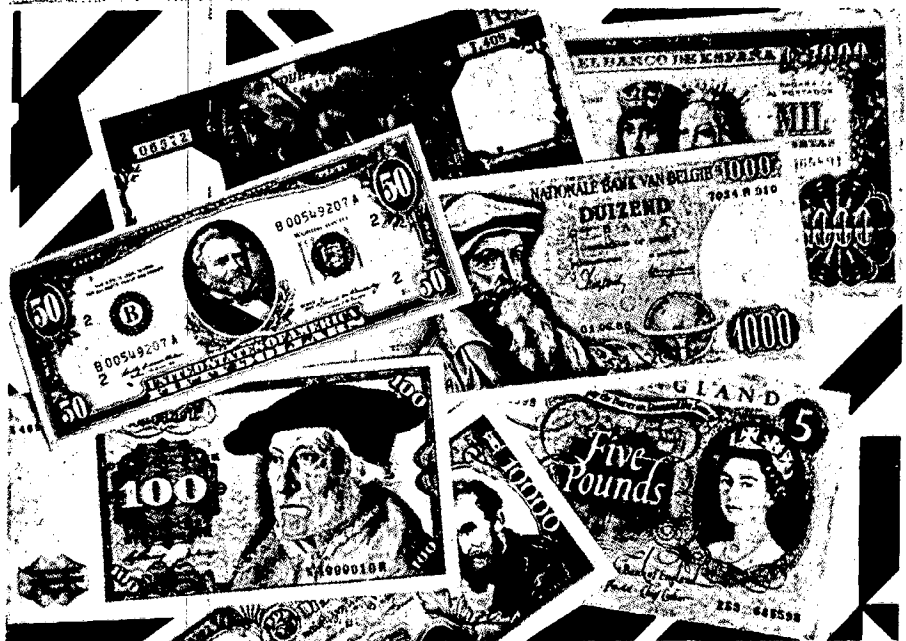
CUADRO 3 DISTRIBUCIÓN DEL ENDEUDAMIENTO PÚBLICO BRUTO POR SECTORES DE ACTIVIDAD. AÑOS 1974/1978. MILLONES DE BOLIVARES Y ESTRUCTURA PORCENTUAL