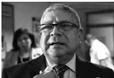
Eladio Aponte Aponte.

La detención del narcotraficante Walid Makled generó, posteriormente, la fuga del país del exmagistrado del TSJ, Eladio Aponte Aponte, y la destitución de más de treinta jueces penales supuestamente vinculados con él. Sin embargo, a pesar de que las investigaciones en Venezuela no avanzan y el Gobierno solo ha dicho que Aponte Aponte fue un caso aislado, éste se entregó a la DEA en Estados Unidos y ha declarado a medios sobre los vínculos de facciones militares y gubernamentales con el tráfico de drogas en el país, su actuación como magistrado en casos de persecución judicial por órdenes políticas y los negociados del sistema de justicia.